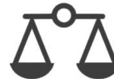
Cyber Legal, Policy and Compliance Officer