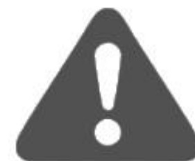
Cybersecurity Risk Manager