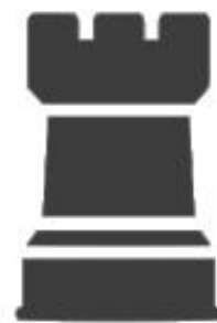
Chief Information Security Officer (CISO)