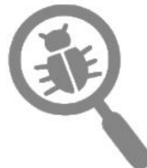
Cyber Threat Intelligence Specialist