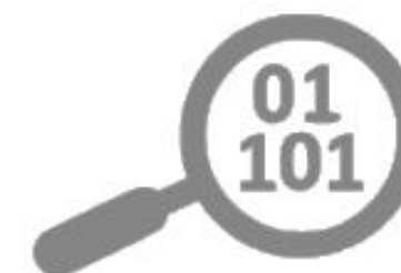
Digital Forensics Investigator