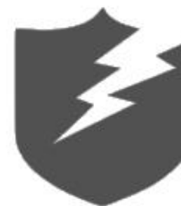
Cyber Incident Responder